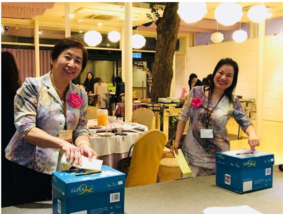
第十一屆第一次社員大會選舉投票情形