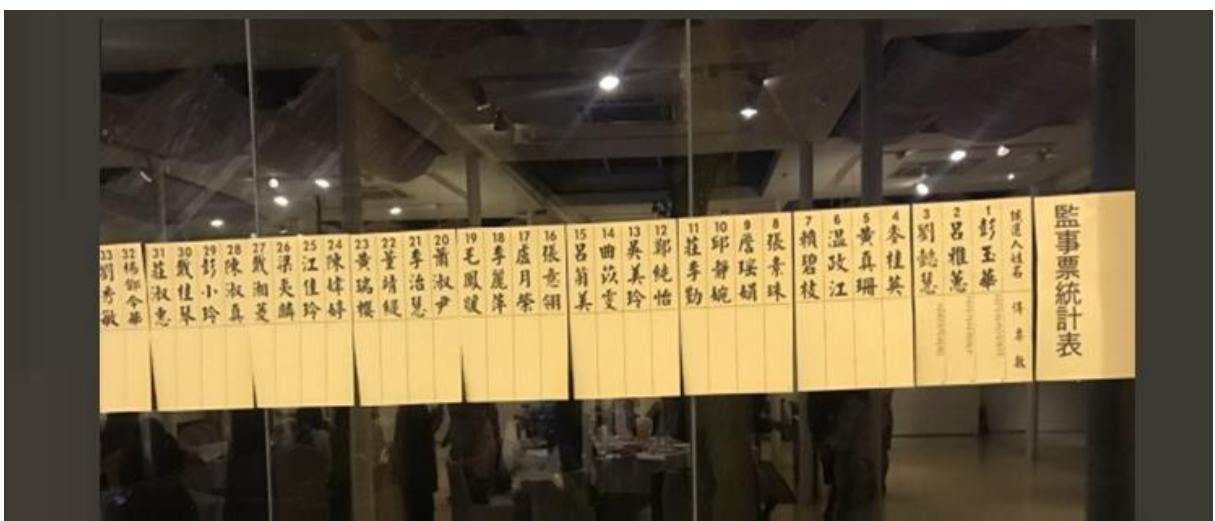
國際崇她桃園社第十一屆理、監事開票結果