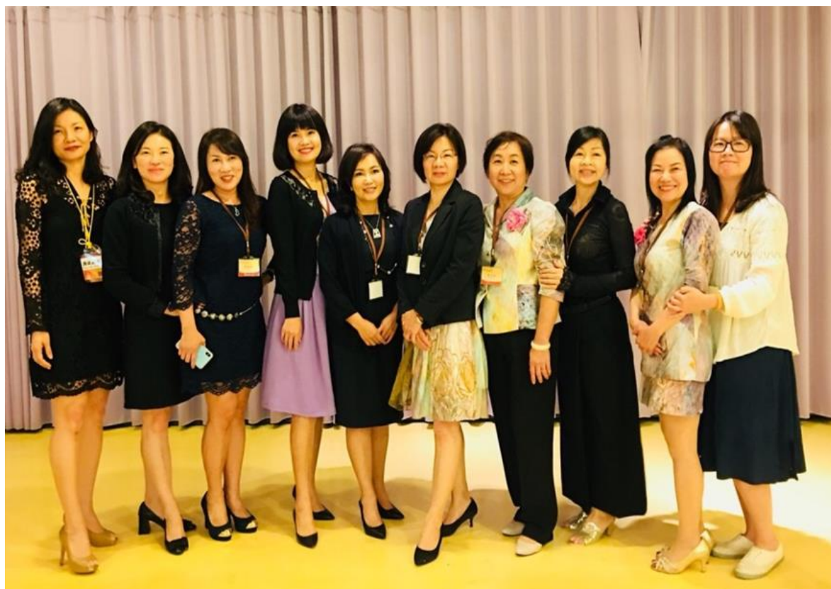
國際崇她桃園社第十一屆理事當選人