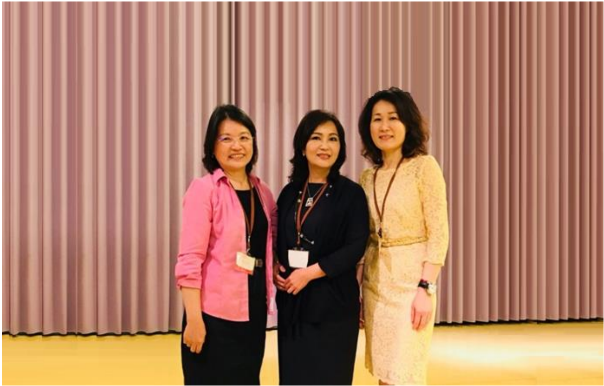
國際崇她桃園社第十一屆監事當選人與監票人合影